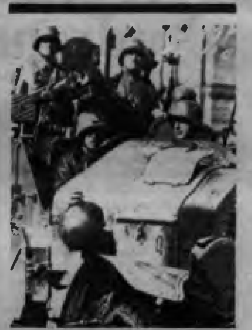
Beyaz Birlikler Baviera Sovyetleri'ni ezmek için ilerliyor.

Weimar Cumhuriyeti kâğıt üzerinde "dünyanın en özgür demokrasisiydi". Gerçekte ise, eski rejimin gerici kurumlarının savunusuna, işçilerin şiddetle bastırılmasına sürekli sıkıyönetimlere ve diktatörlüklere (1918-1919'un kanlı bir biçimde bastırılması; 1920'de Kapp Darbesi'nden sonra Ruhr'daki terörde, ayaklamaya katılan subayların kurdukları askersel mahkemeler devrimci cumhuriyeti savunmuş işçilerin yargılanması; 1921'de Saksonya'daki Hosing terörü; 1923'de Saksonya'da seçimle başa gelmiş Zeigner hükümetini Reich'in askersel devirmesi; von Seeckt diktatörlüğü ve tüm Almanya'da sıkıyönetim; 1929'da Severing'in emriyle 1 Mayıs gösterilerinde işçilerin kurşunlanması; 1930'dan 1933'e dek