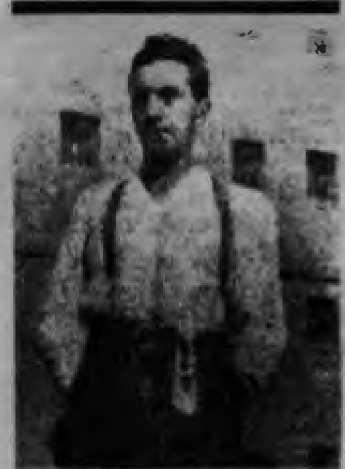
Ernst Toller, ilk Alman Sovyet Cumhuriyeti'nin başkanı.

Alman nasyonal sosyalizminin yığın ajitasyonu, 1920'de benimsenmiş olan Yirmi beş maddeli programa dayanıyordu. Nazi ajitasyonu, özellikle, Hitler'in, daha sonra da Gobelis ve Strasser'in yönetiminde geliştirildi. Yal-