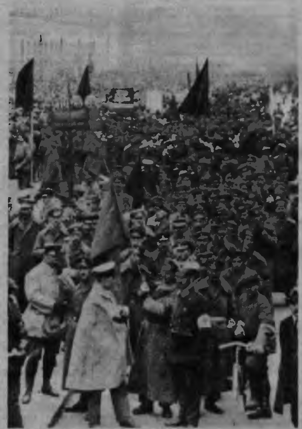
Büyük Oktobr'in alevleri tüm Avrupa'yı sarmış, buralarda devrimin meşalelerini yakmıştı. Bunun en canlı örneklerinden biri de Baviera Sovyet Cumhuriyeti'nin kurulmasıydı.

Faşizmin habercisi olan ilk karşı-devrimci birimler subaylardan ve eski subaylardan oluşuyordu. Nasyonal sosyalizmin