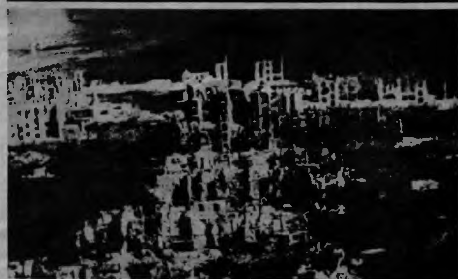
Yiğit Sovyet halkı SBKP'nin Leninci Önderliğinde kısa sürede savaşın yaralarını sardı, yıkıntıların üzerine yeni binalar, fabrikalar kurdu.