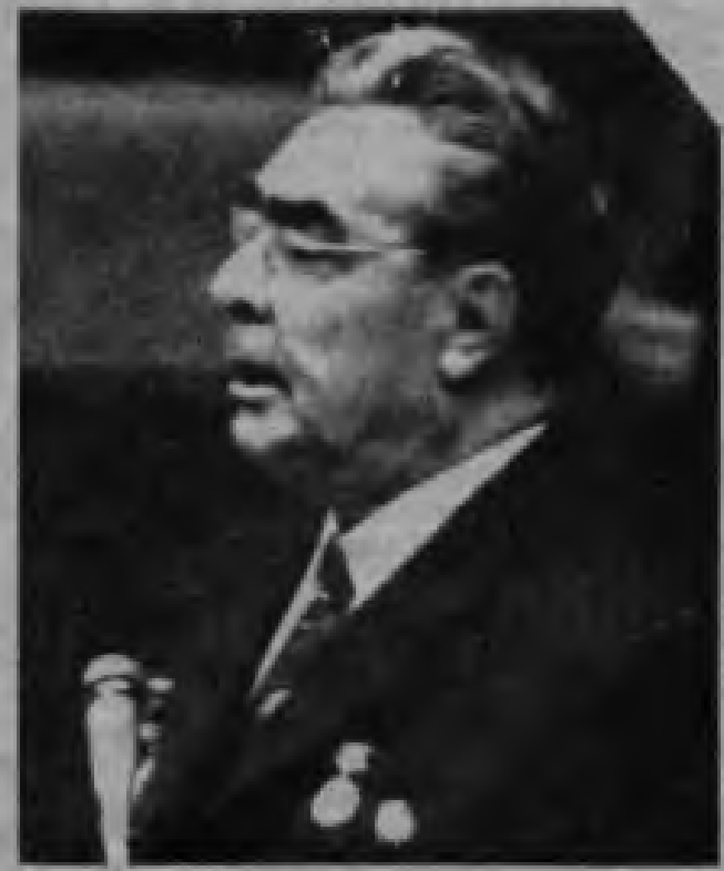
SBKP Genel Sekreteri Leonid Iliç Brejnev

Kızıl Ordu'nun dünyayı Hitler faşizminden kurtarmasından bu yana 33 yıl geçti. 9 Mayıs 1978'de Büyük utku'nun 33. yıldönümünü kutladık. Bu utkunun yüce yaratıcısını, yiğit Sovyet halkını ve 22 milyon şehidini saygıyla andık, anıyoruz.