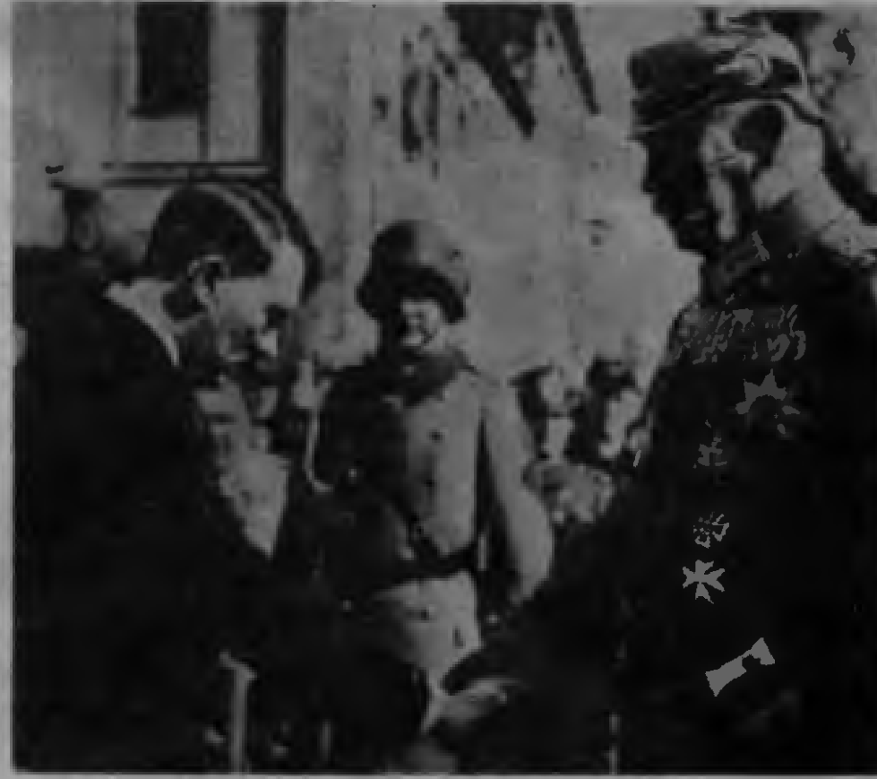
Cumhurbaşkanı Hindenburg, Potsdam'da Reichtag'ın (Almanya parlamentosu) töreninde Hitler'le el sıkışıyor. Burjuvazi, erki nazilerin eline sunuyor.

Üçüncü belirleyici adım, temmuz 1932'de von Papan'ın Prusya'daki sosyal demokrat hükümeti devirmesini pasifçe kabullenmekti. Herkes genel grevi kaçınılmaz görüyordu. Oysa sosyal demokrat bakanlar, Leipzig'deki yüce mahkemeye başvurular. Mahkeme, ince yasal tartış-