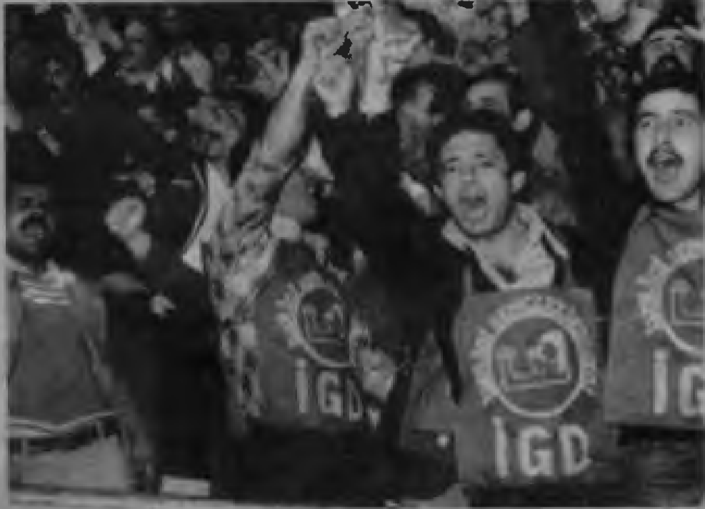
"TKP'ye özgürlük" belgisi salonları inletti

Kongre'de Ulusal Demokratik Cephe'nin güçlendirilmesine önemle eğilindi. Faşist tirman-