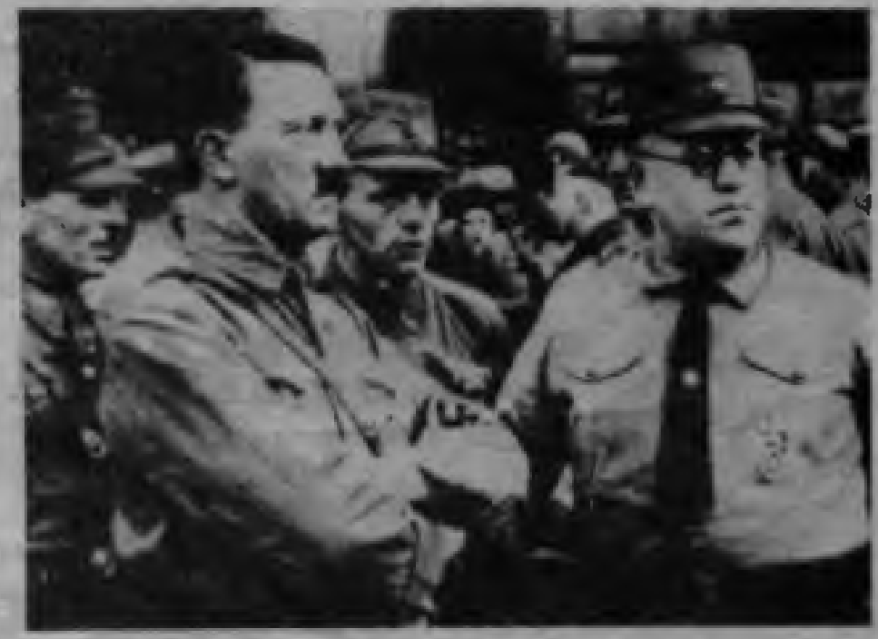
Hitler, SS birliklerinin bir resmi geçidinde. Ancak sosyal demokratların yardımı olmadan faşist erkin yolunu temizlemeye ne SA'lar ne de SS'ler yetmezdi.

sınıfının birleşik savaşıydı. Komünist Partisi de tüm çabalarını buna yöneltti. Sorun giderek daha güncelleştikçe, Komünist Partisi, faşizme ve kapitalist saldırıya karşı birleşik işçi sınıfı cephesi için, hem işçi yığına, hem de özellikle Sosyal Demokrat Parti'ye ve Genel Sendikalar Federasyonu'na çağrı üzerine çağrı yayınladı.