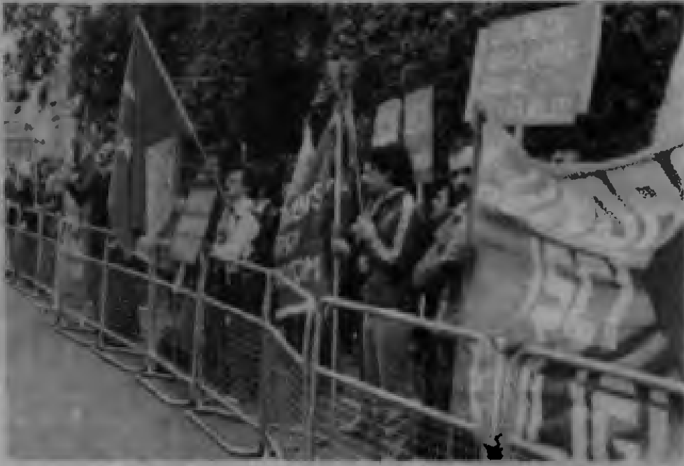
Elçilik önündeki gösteriden bir görünüş

Ecevit hükümetinin işçi sınıfımızın, halkımızın bu en demokratik istemine karşı aldığı tavır, yurtda ve yurtdışında büyük bir tepkiyle karşılandı. İngiltere'de de İTİB olayı protesto etmek ve İngiltere demokratik kamuoyuna duyurmak amacıyla